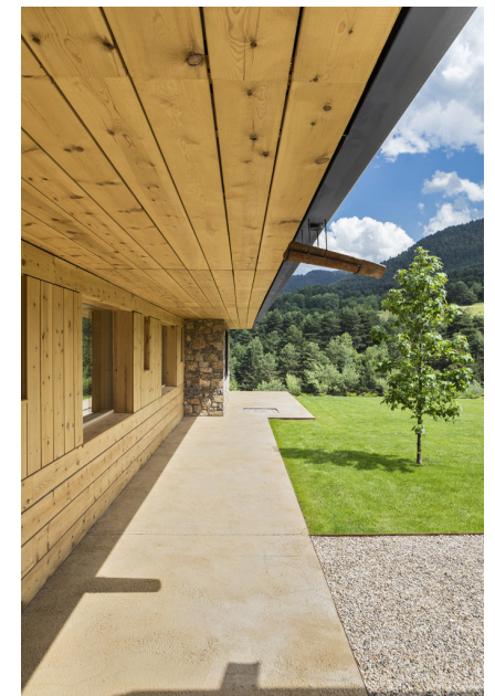
Casa rural en la Cerdanya. Dom Arquitectura. Arquitecto: Pablo Serrano.