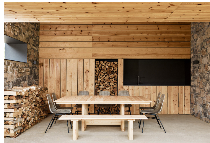
Casa rural en la Cerdanya. Dom Arquitectura. Arquitecto: Pablo Serrano.